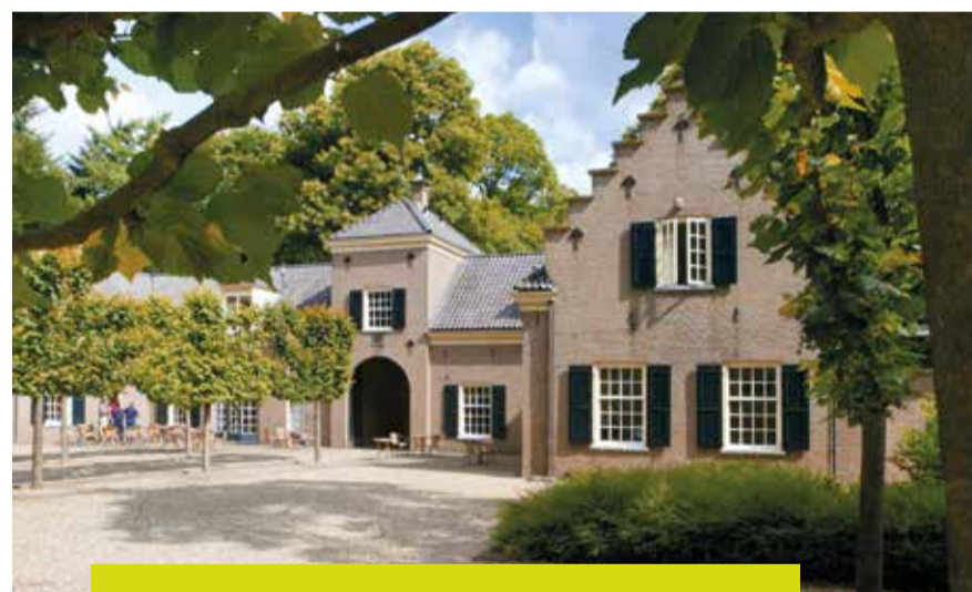
CAMPUS LANDGOED ZONHEUVEL