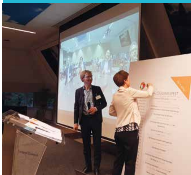
Ondertekening van het Dialoogmanifest