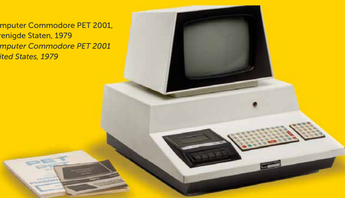
Computer Commodore PET 2001, Verenigde Staten, 1979 Computer Commodore PET 2001 United States, 1979