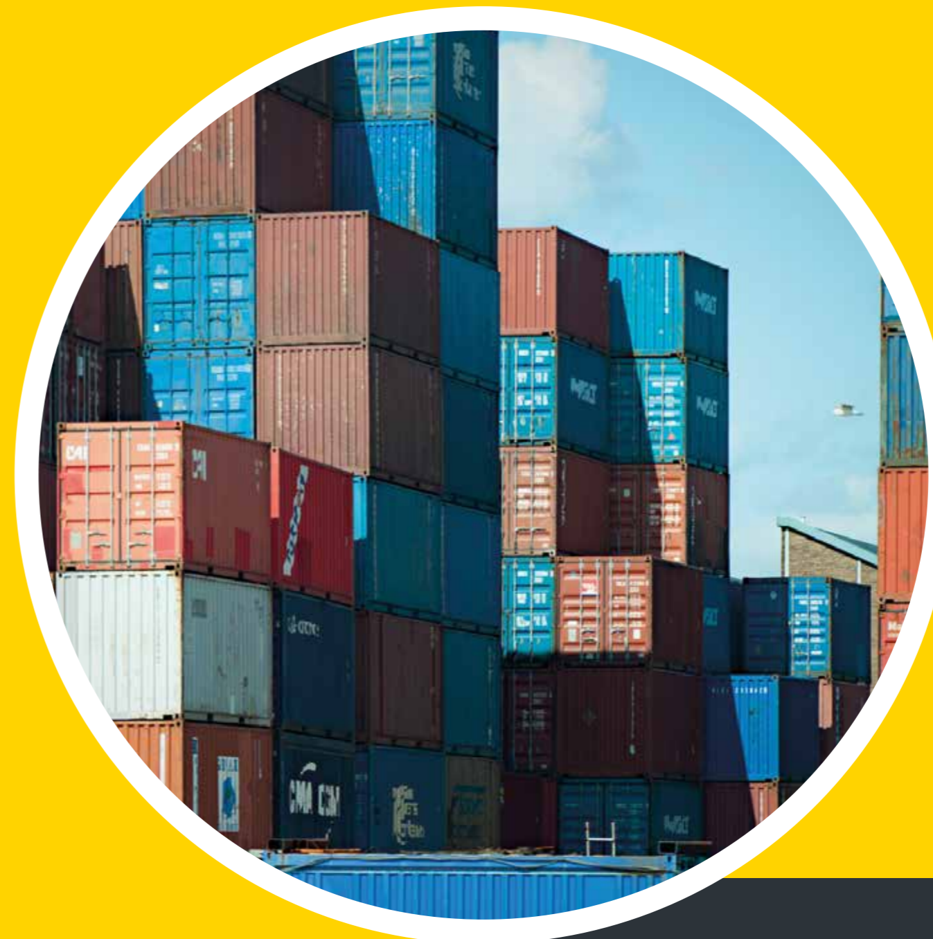
Containers in de haven, Rotterdam, Nederland, 2011 Containers in the port Rotterdam, Netherlands, 2011

Investments in infrastructure and innovation are an important driver of economic growth and development. More jobs, more opportunities for trade, and better access to healthcare and schools all help to raise living standards. To guarantee everyone has equal access to information and knowledge, people all over the world must have internet access. This also helps foster entrepreneurship and innovation.