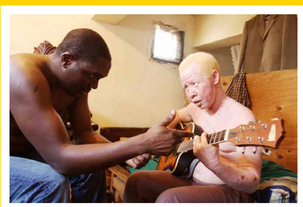
Albino jongen in Mozambique, 2010 Albino boy in Mozambique, 2010