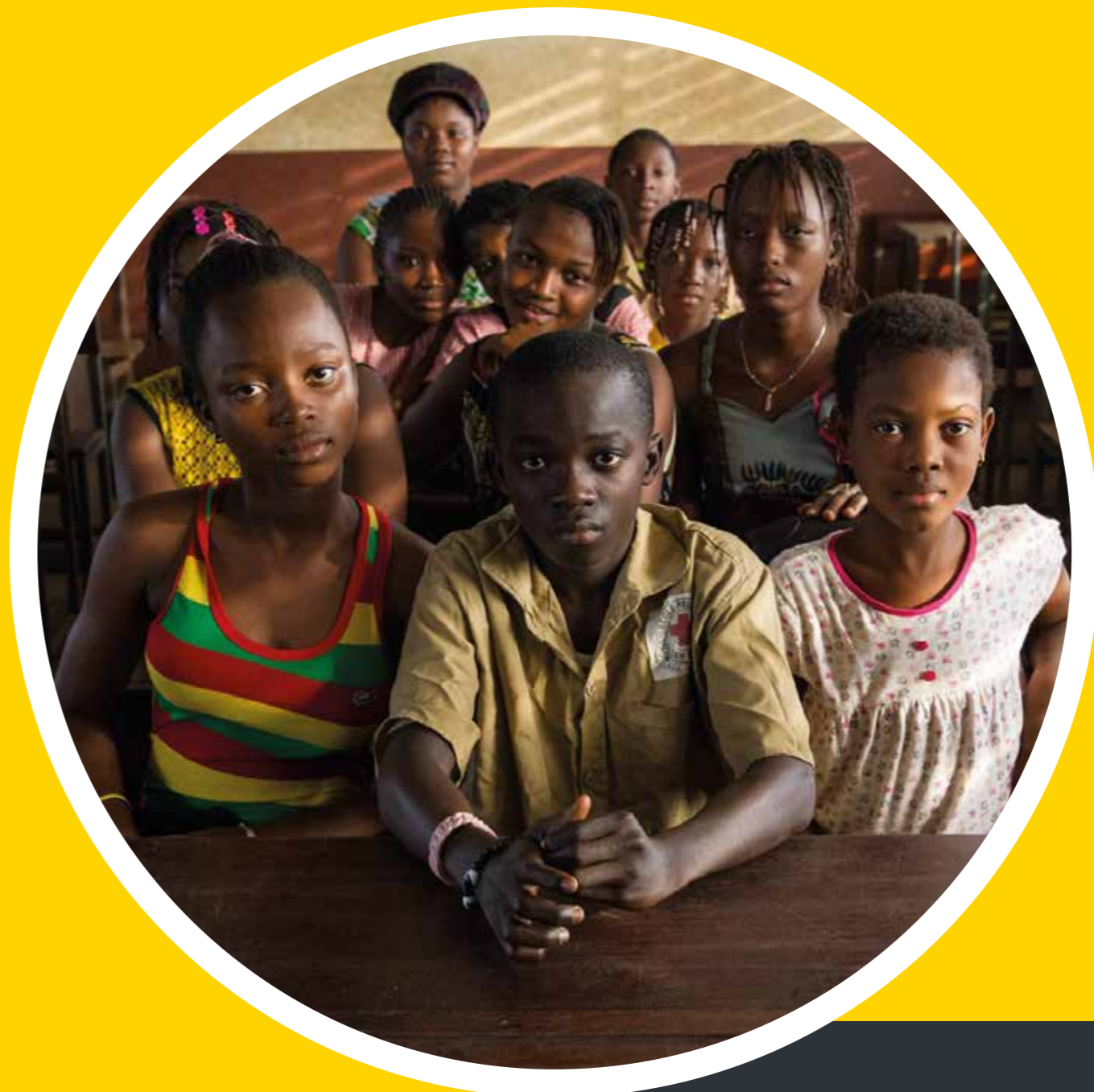
Republiek Guinee, 2015 Republic of Guinea, 2015

More and more children in the world are going to school, particularly girls. Illiteracy has fallen sharply as a result. It is now time to shift the focus to secondary education. Many children do not have access to this level of education, which they need to get a good job or start a successful business. The United Nations has set itself the goals of providing equal educational opportunity for boys and girls, ensuring more young people attend secondary school and improving vocational training.