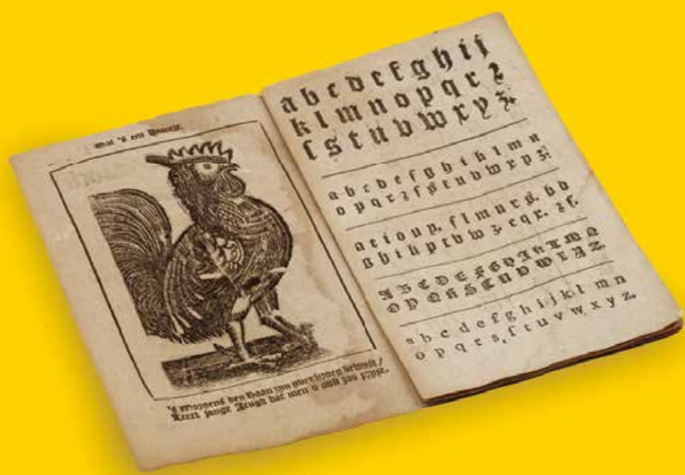
Haneboekje, methode om te leren lezen, Nederland, 1805 Literacy method, Netherlands, 1805