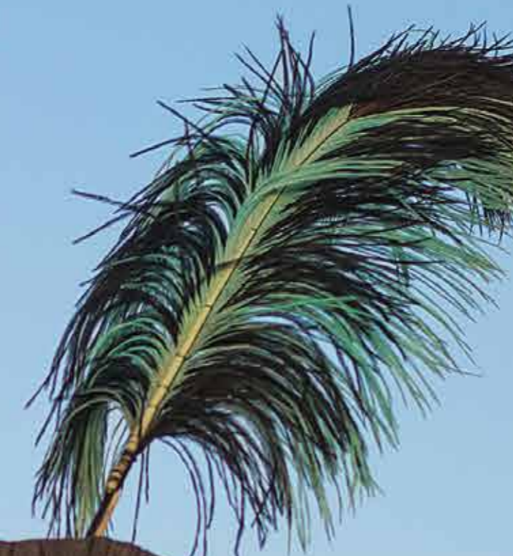
Gerewol-feest, Niger, 2014 Gerewol-feest, Niger, 2014

Beauty contests just for women? Not in Niger. During a festival to celebrate the rainy season the Wodaabe hold a men's beauty contest. The men make themselves up and put on their finest clothes. A female jury chooses the winner.