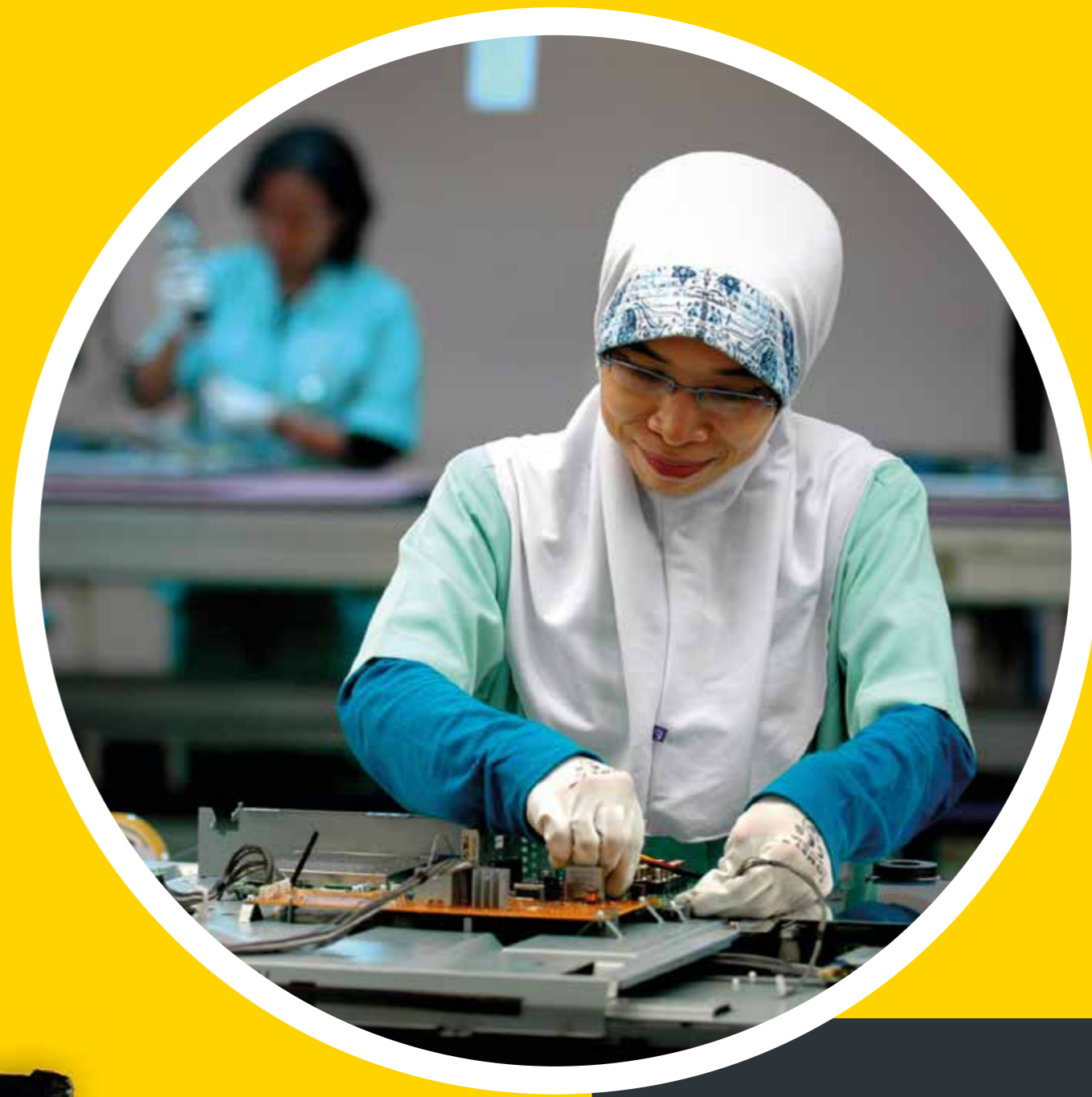
Aan het werk in een elektronica-fabriek, Indonesië, 2007 Working in an electronics factory Indonesia, 2007

Equality between men and women is a key human right, and contributes to development. That is why the United Nations combats discrimination against women on the labour market, as well as sexual violence and sexual exploitation. The UN also campaigns for men and women to take a more equal share of domestic work and childcare, and for women to have greater influence in politics, and in the public and private sectors.