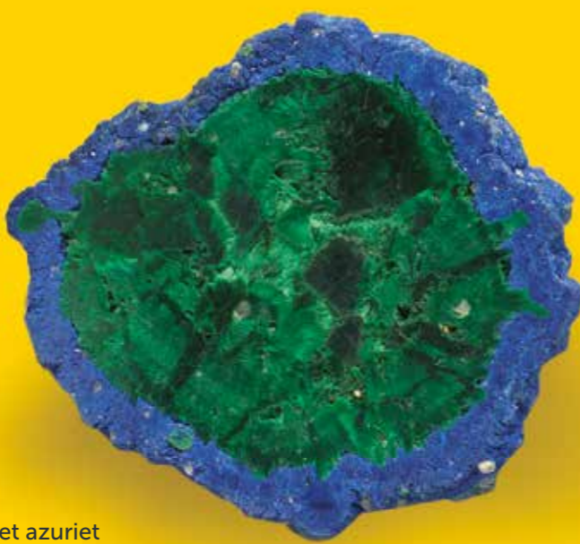
Het kopererts malachiet met azuriet Malachite with azurite