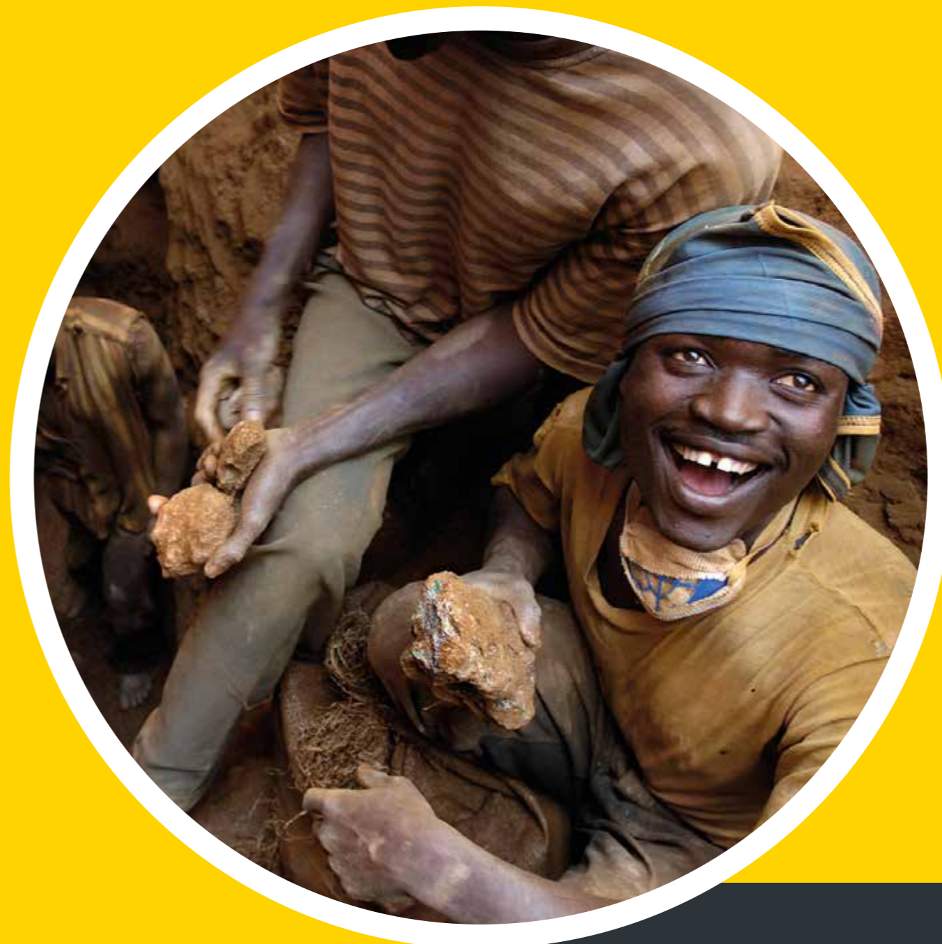
Jonge mannen werken in een kopermijn, Congo Young man working at a copper mine, Congo

All over the world, more and more people are joining the ranks of the middle classes. Extreme poverty is on the decline. At the same time, however, economic inequality has increased and the growth in jobs is not keeping pace with the growth in the labour force. The United Nations is therefore working to achieve sustainable economic growth through innovation. It sees entrepreneurship and job creation as important weapons in the fight against forced labour, slavery and human trafficking.